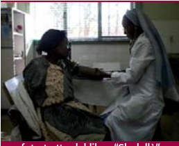
foto tratta dal libro "Shelallà"